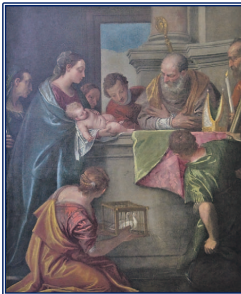
Figura enmarcada dentro del manierismo italiano en Venecia. Sus obras más famosas son elaborados ciclos narrativos, ejecutados en un estilo dramático y colorista, llenos de majestuosos escenarios arquitectónicos y brillante pompa. Son especialmente famosos sus grandes cuadros de fiestas bíblicas, y repletos de figuras que suelen permanecer en los lugares para los que fueron pintados. Las obras de porte menor están en museos.